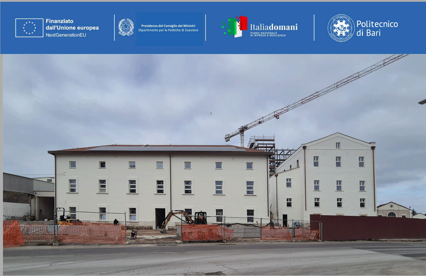
FORNITURA E POSA IN OPERA DI COMPONENTI DI ARREDO E PARETI VETRATE PRESSO L'AGRIFOOD HUB